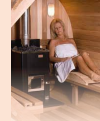
- Poêle à bois