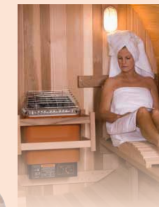
- Poêle électrique